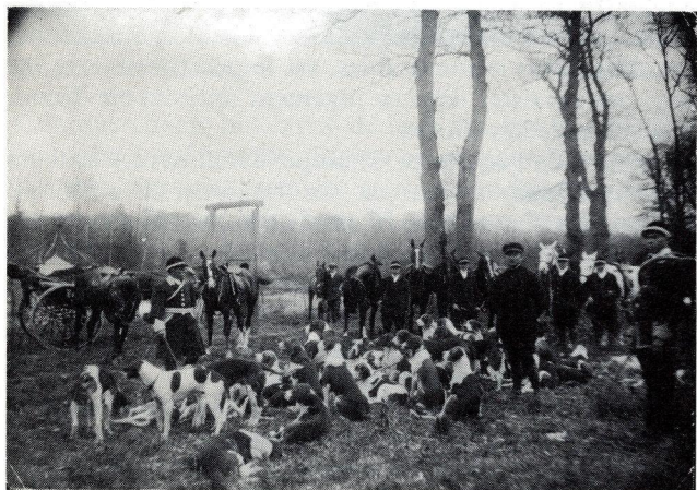
5ème photo DEBUCHER (fils de PIQU'AVANT) alors qu'il était devenu 2ème piqueux*